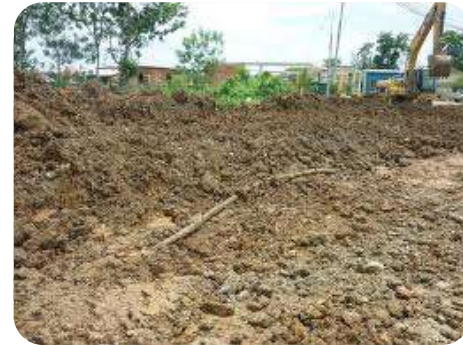
Penamatan Bersama Akibat Penggantungan Kerja