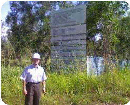
Kemungkiran oleh Kontraktor

Perakuan Muktamad hendaklah disediakan bagi projek yang ditamatkan Pengambilan Kerja Kontraktor untuk: