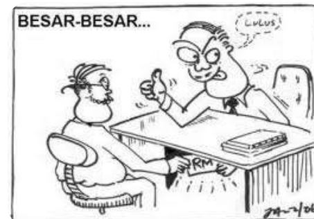
Penamatan Akibat Rasuah