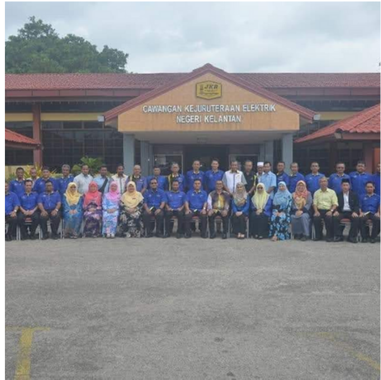
LAWATAN KERJA PENGARAH JKR KELANTAN KE JKR CAWANGAN KEJURUTERAAN ELEKTRIK NEGERI KELANTAN.