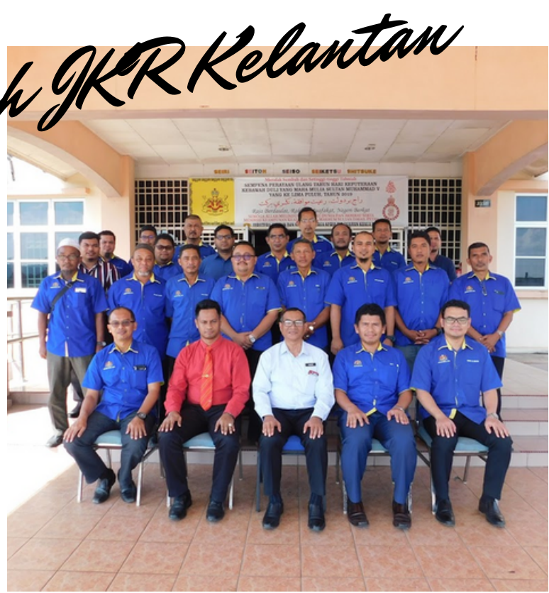
LAWATAN KERJA PENGARAH JKR KELANTAN KE JKR JAJAHAN KUALA KRAI.