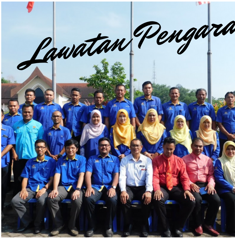
LAWATAN KERJA PENGARAH JKR KELANTAN KE JKR JAJAHAN GUA MUSANG.