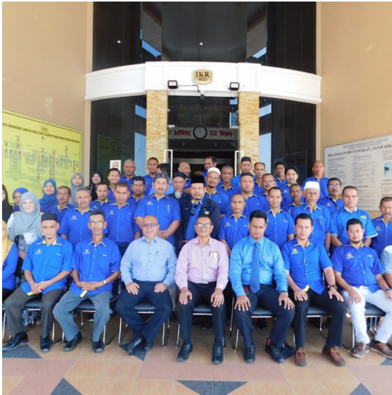
LAWATAN KERJA PENGARAH JKR KELANTAN KE JKR JAJAHAN TANAH MERAH.