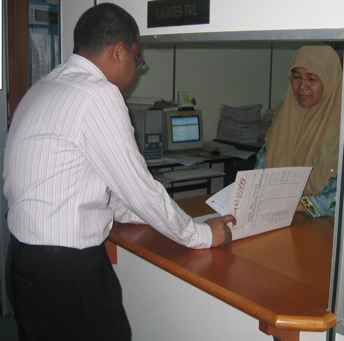
PEJABAT KETUA PEGAWAI KESELAMATAN KERAJAAN JABATAN PERDANA MENTERI