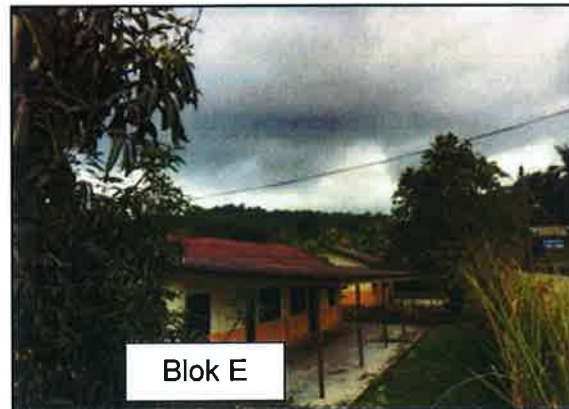
Gambar 5 : Blok E (JKR 4533)