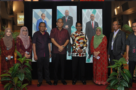
Bahagian Penyelarasan Dan Khidmat Sokongan Cawangan Kejuruteraan Elektrik